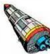
la navicella spaziale